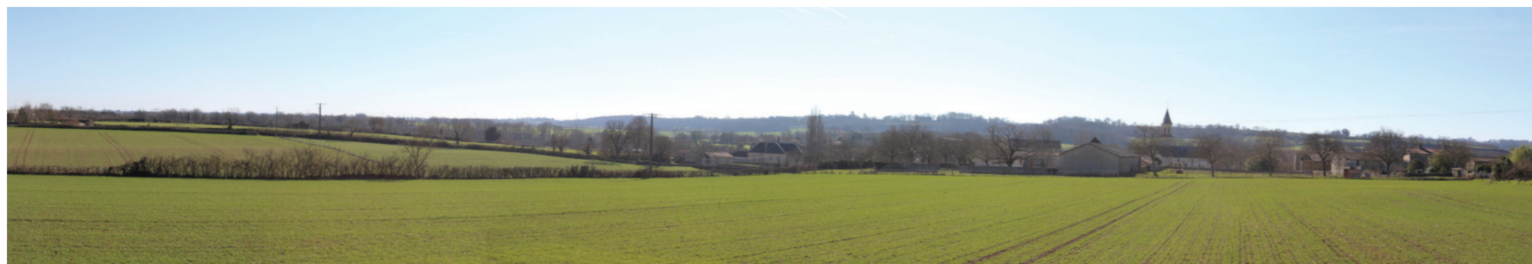
Vue panoramique de l'état initial (angle de vue 120°)