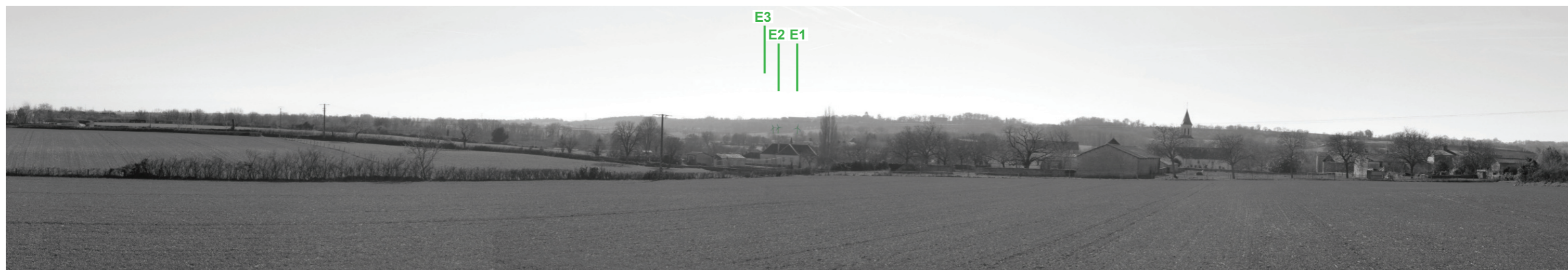
Vue panoramique noir et blanc avec esquisse du projet (angle de vue 120°)